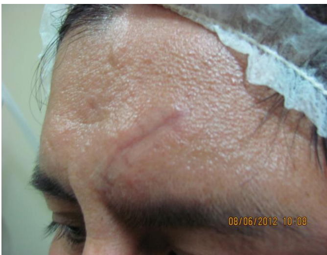
Fig. 2: Paciente caso 1, con tres sesiones de carboxiterapia.