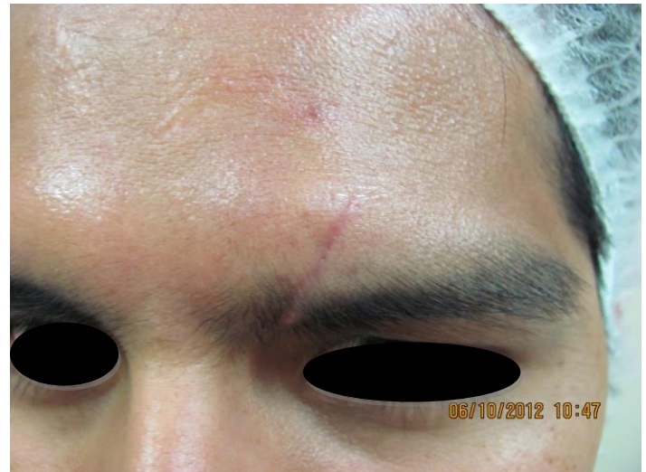
Fig. 4: Paciente caso 2, antes de inicio de tratamiento con carboxiterapia