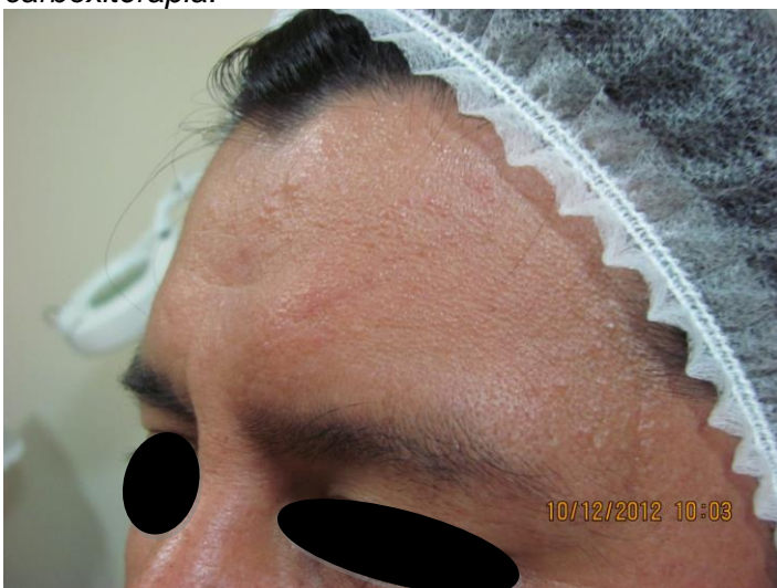
Fig. 3: Paciente caso 1, con 10 sesiones de carboxiterapia.

El efecto regenerador en piel, se explica a nivel de su efecto bioquímico en los tejidos (fig. 6), el año 2005 Irie et all demostraron por primera vez que el CO 2 favorecería la inducción local del factor de crecimiento del endotelio vascular o VEGF (por sus siglas en inglés), esto a la vez se asocia con la producción de óxido nítrico en endotelio el mismo que está relacionado con el efecto vasodilatador observado además de la movilización de células progenitoras endoteliales y formación de nuevos vasos (8), otros efectos benéficos del óxido nítrico en la reparación de heridas se han atribuido a su influencia en angiogénesis, inflamación, proliferación celular, deposición de la matriz y remodelación (9,10). Los resultados de ambos pacientes evidenciaron mejoría en la piel, con atenuación de la cicatriz inicial, con mayor rapidez y mejor resultado final en el caso de la herida más reciente. Los resultados coinciden con los hallados