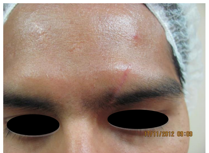
Fig. 5: Paciente caso 2, luego de 3 sesiones de tratamiento con carboxiterapia.