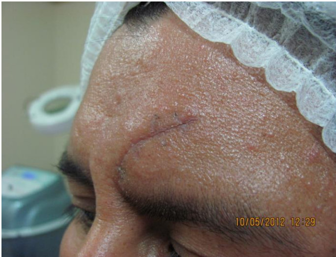
Fig. 1: Paciente caso 1 antes de inicio de carboxiterapia.